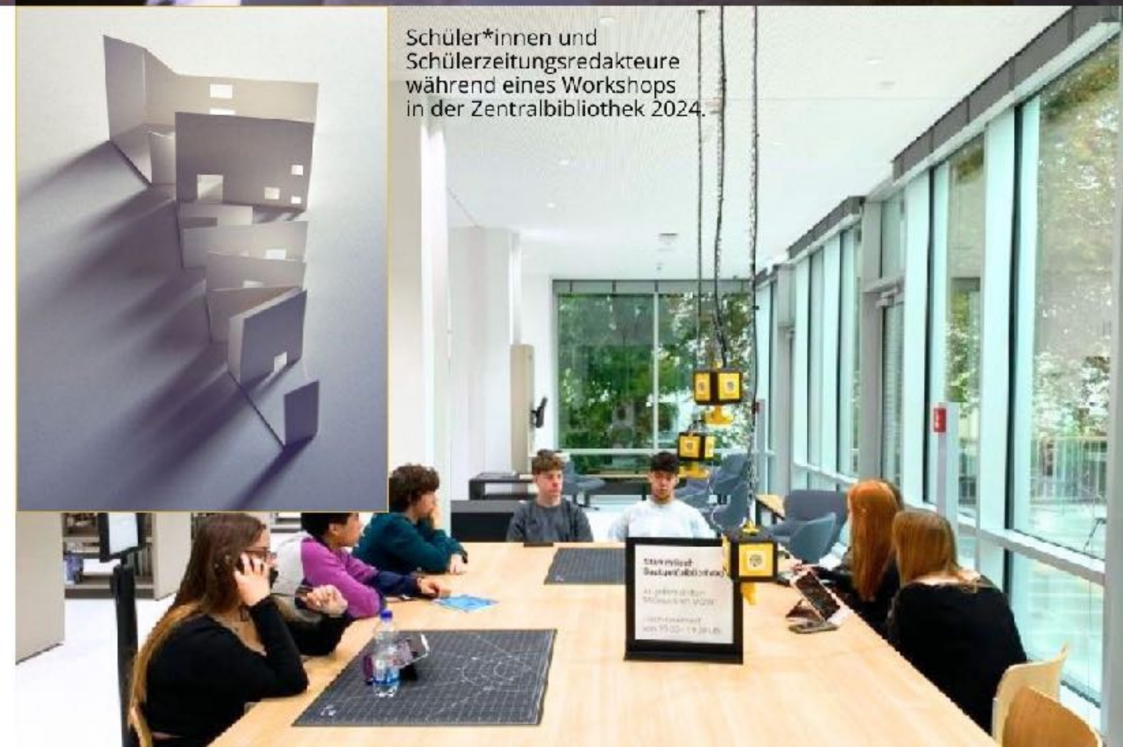
Schüler*innen und Schülerzeitungsredakteure während eines Workshops in der Zentralbibliothek 2024.

Konkretisierung der Entwürfe und modellhafte Umsetzung