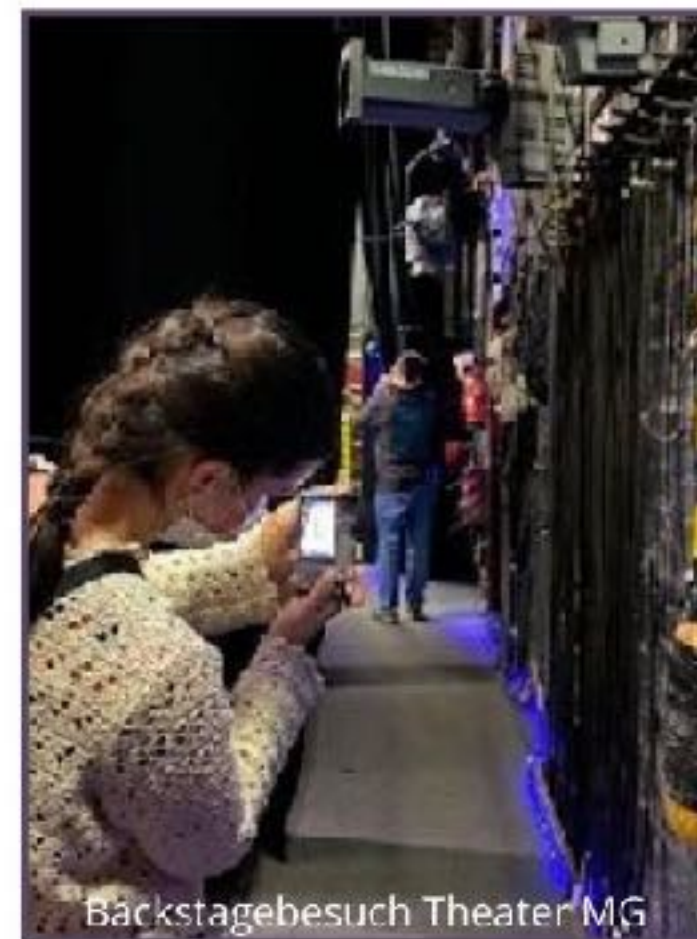
Backstagebesuch Theater MG